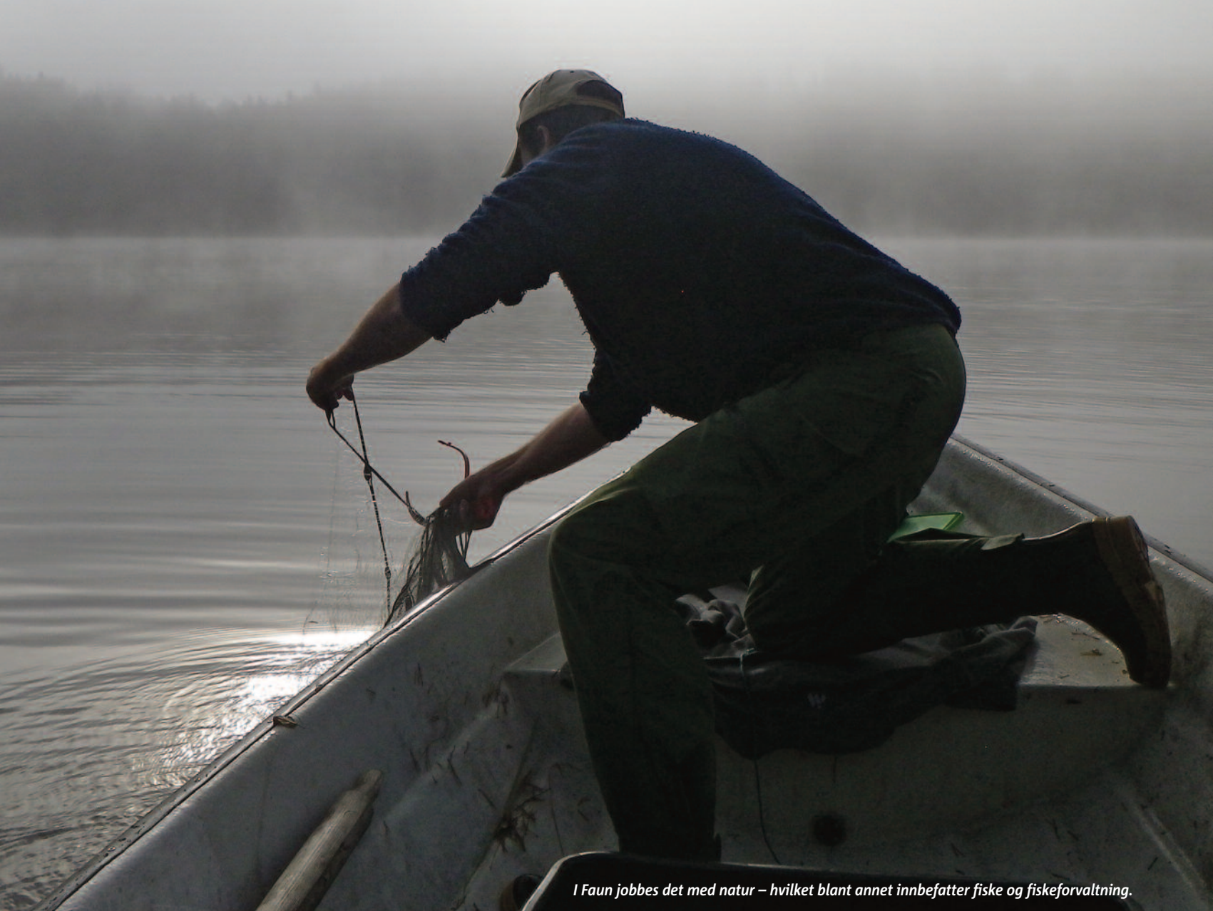
I Faun jobbes det med natur – hvilket blant annet innbefatter fiske og fiskeforvaltning.

Siden 2002 har selskapet således utarbeidet mer enn 150 miljøvurderinger for småkraftverk etter krav fastsatt av NVE.